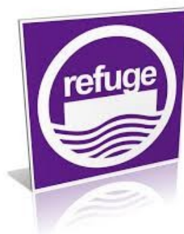
Schéma plan d'évacuation